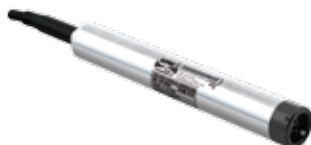
MEAS KPSI 500, 501