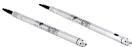
MEAS TruBlue记录仪 555液位 575气压, 585 CTD