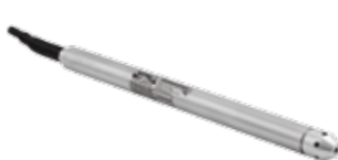
MEAS KPSI 351,353,355