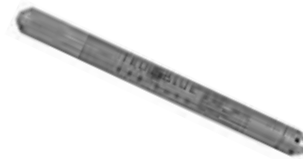
MEAS TruBlue记录仪 275气压