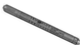
MEAS TruBlue记录仪 255 液位