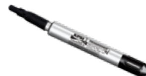
MEAS KPSI 380