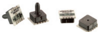
MEAS MS1451, MS1471