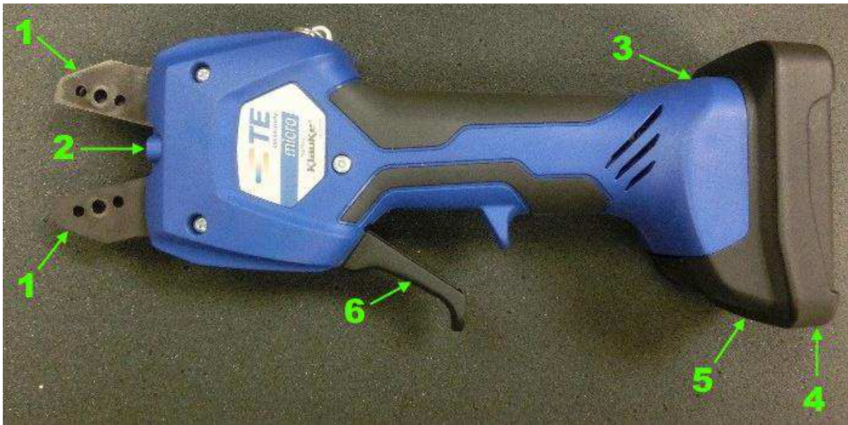
Obrázok 1 Error! Bookmark not defined. : Súprava krimpovacieho nástroja s nainštalovanou batériou