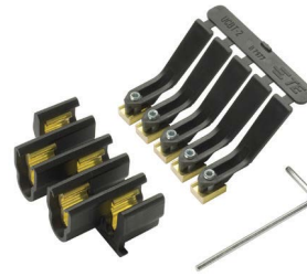
Universell einsetzbarer Verbinderblock

Die beiden robusten Gehäusehälften werden einfach zusammengedrückt, bis die Verschlüsse einrasten. Es ist kein Spezialwerkzeug notwendig, das Gehäuse muss nicht nachbearbeitet werden, es gibt kein Mischen, Befüllen oder Aushärten von Flüssigkeiten und keine Flamme. Nach der Installation kann die Muffe sofort in Betrieb genommen werden.