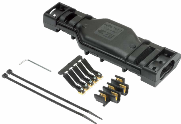
RayGel Plus 2/3 Kit-Inhalt

Diese sehr kompakte Verbindungslösung kann hervorragend in beengten Einbauverhältnissen eingesetzt werden, die einen großen Anwendungsbereich erfordern.