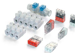
Klemmleisten und Dosenklemmen

PowerGel gefüllte Muffenschale, Universal Verbinderblock mit Installationshilfe und Imbusschlüssel (für RayGel Plus 2/3 Muffen), Kabelbinder zur Herstellung der Zugentlastung und bebilderte Montageanleitung.