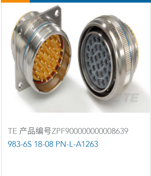
TE 产品编号ZPF9000000000008639 983-6S 18-08 PN-L-A1263