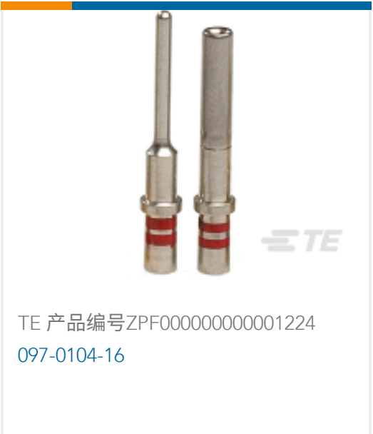
TE 产品编号ZPF000000000001224 097-0104-16