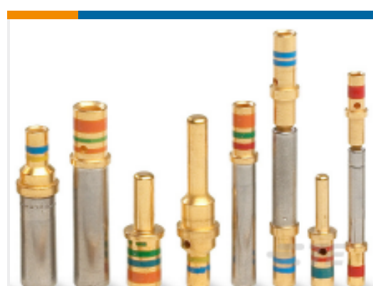
TE 产品编号 ZPF000000000001234 097-0166-12