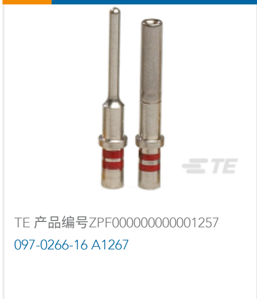
TE 产品编号ZPF000000000001257 097-0266-16 A1267