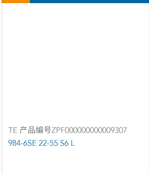
TE 产品编号ZPF0000000000009307 984-6SE 22-55 S6 L