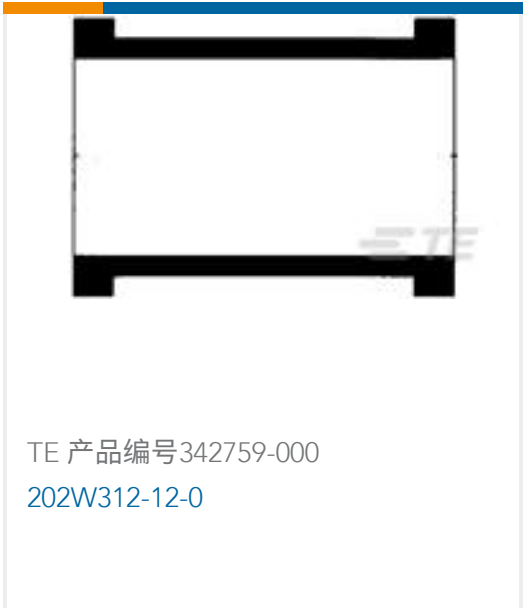
TE 产品编号342759-000 202W312-12-0