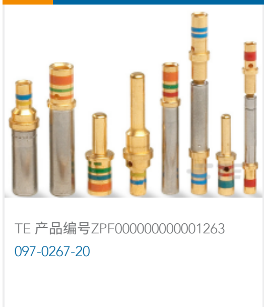
TE 产品编号ZPF000000000001263 097-0267-20