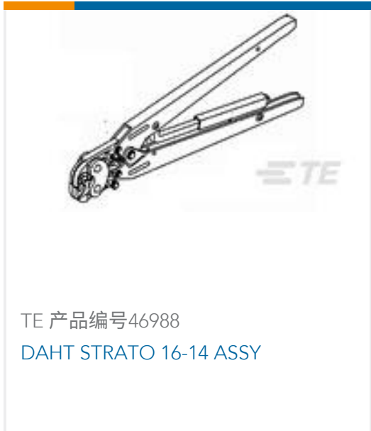
TE 产品编号46988 DAHT STRATO 16-14 ASSY