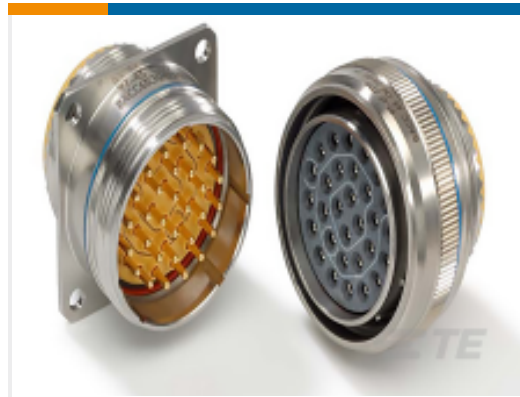
TE 产品编号ZPF000000000008068 983-6K 08-98 SN-L