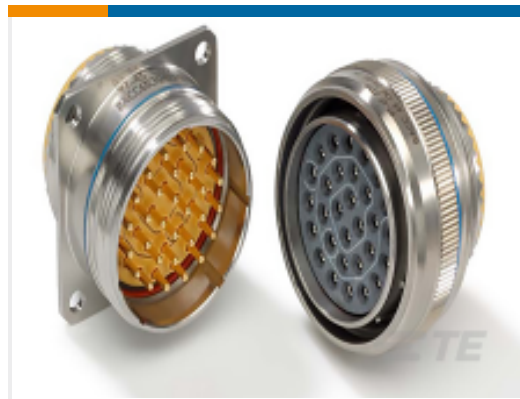
TE 产品编号ZPF100000000007509 983-0SE 10-06 S7 L