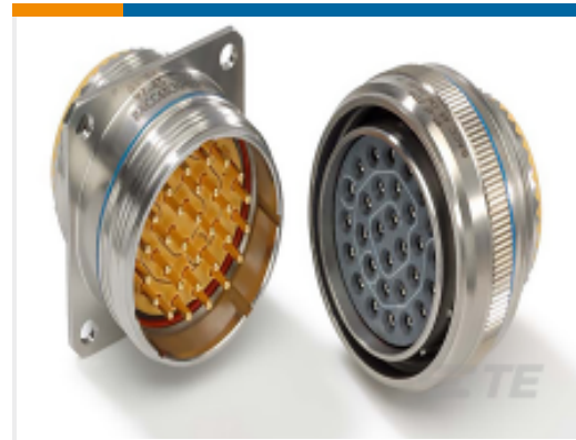
TE 产品编号ZPF000000000009071 983-6W 12-12 SN-L