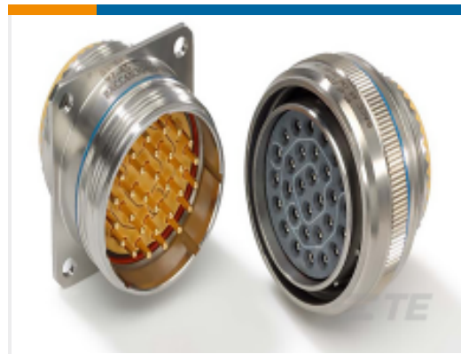
TE 产品编号ZPF1000000000033774 983-0SE 20-16 S6 L