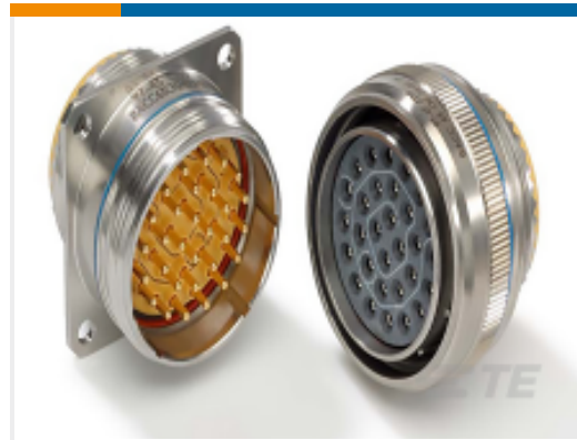
TE 产品编号ZPF000000000008848 983-6SE 14-07 SN-L