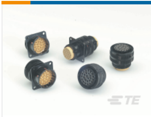
TE 产品编号ZPF00000000019862 FDBA 57-12-10 SN-K 090 A499