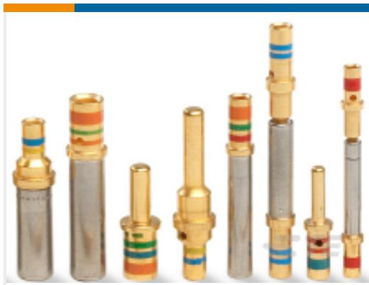
TE 产品编号ZPF00000000001235 097-0177-16