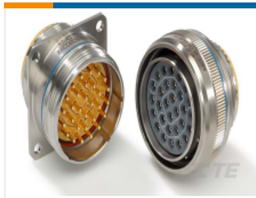
TE 产品编号ZPF000000000008408 983-6RS 10-06 SN-L