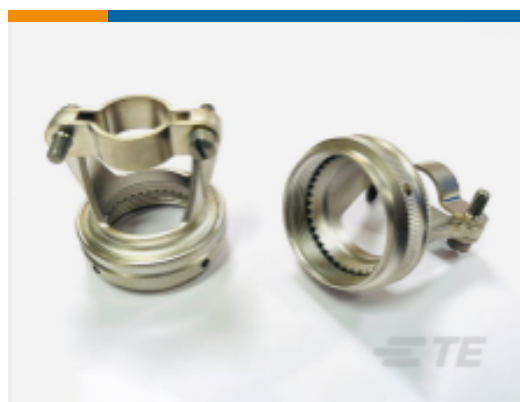
TE 产品编号2275011-7 ASSY,EN3660-004, SS-PA BACKSHELL, SZ20