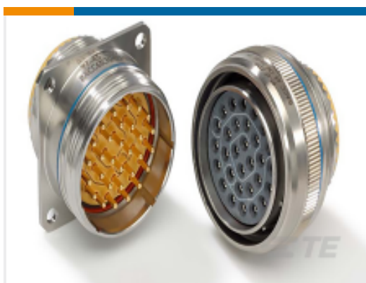
TE 产品编号ZPF100000000008768 983-6SE 10-06 SN-L