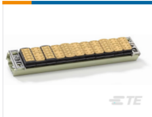
TE 产品编号ZPF00000000020160 FMJ 11E 20-11 G