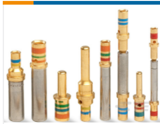
TE 产品编号ZPF00000000000399 006-1104-16 A