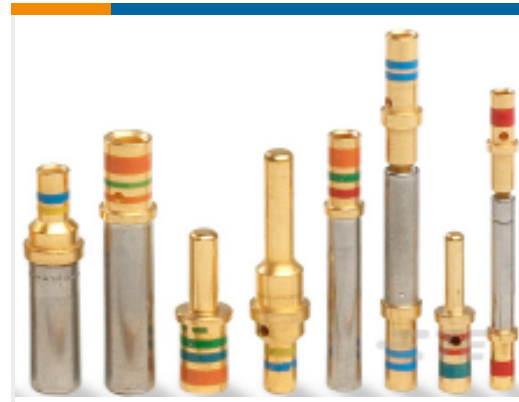
TE 产品编号ZPF00000000001234 097-0166-12