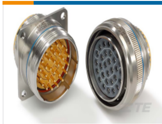
TE 产品编号ZPF100000000008743 983-6SE 10-05 PN-L