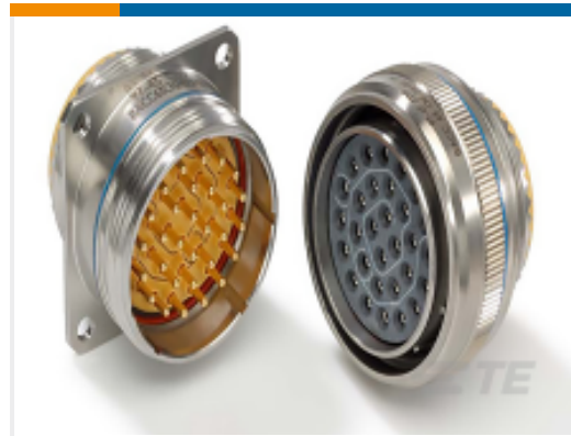
TE 产品编号ZPF100000000009142 983-7SE 16-24 PN-L