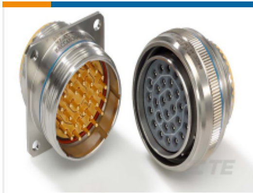
TE 产品编号ZPF100000000008141 983-6K 18-14 SN-L