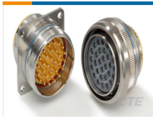
TE 产品编号ZPF100000000009142 983-7SE 16-24 PN-L