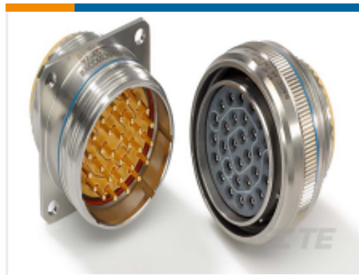
TE 产品编号ZPF100000000008816 983-6SE 12-12 SN-L