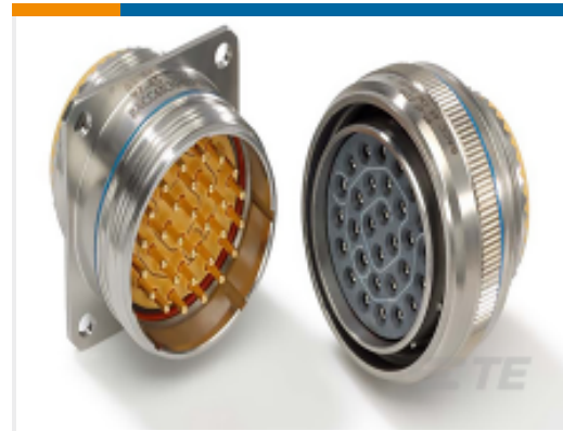
TE 产品编号ZPF100000000008221 983-6KE 12-03 S6 L