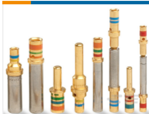
TE 产品编号ZPF000000000003591 724-0001-16