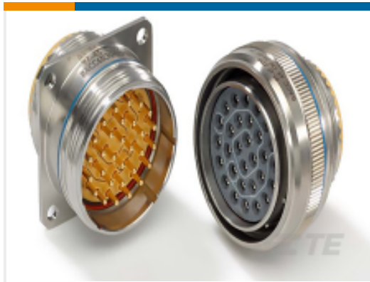
TE 产品编号ZPF100000000007604 983-0SE 16-24 P6 L