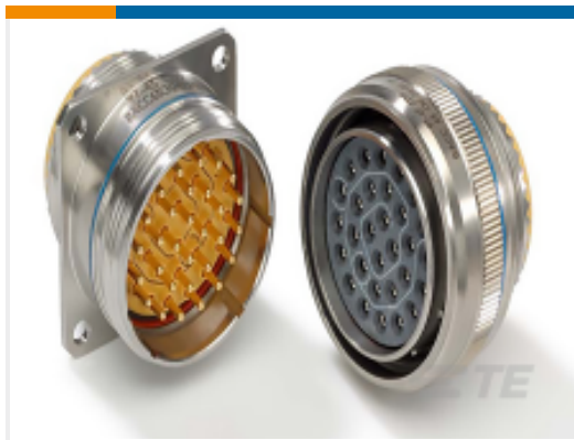
TE 产品编号ZPF100000000008743 983-6SE 10-05 PN-L