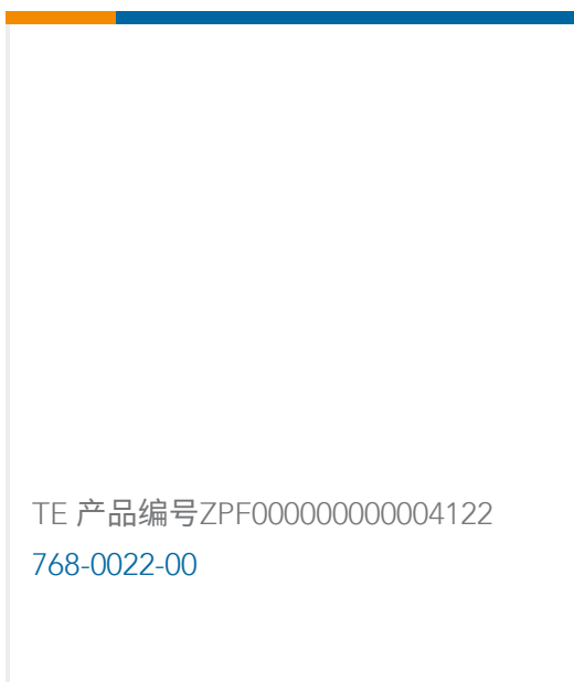
TE 产品编号ZPF000000000004122 768-0022-00