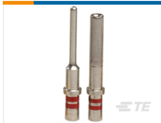
TE 产品编号ZPF000000000001952 182-0297-20