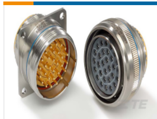
TE 产品编号ZPF10000000008768 983-6SE 10-06 SN-L