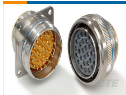
TE 产品编号ZPF10000000007505 983-0SE 10-06 PN-L