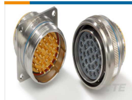
TE 产品编号ZPF10000000008816 983-6SE 12-12 SN-L