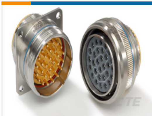
TE 产品编号ZPF10000000008726 983-6SE 08-03 SN-L