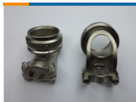
TE 产品编号2275013-7 ASSY,EN3660-005, SS-PA BACKSHELL, SZ20