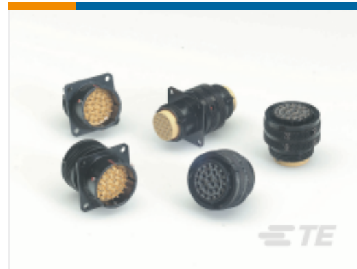
TE 产品编号ZPF00000000019827 FDBA 56-8-98 SN-K 090