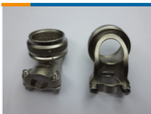
TE 产品编号2275013-1 ASSY,EN3660-005, SS-PA BACKSHELL, SZ08