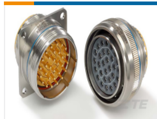
TE 产品编号ZPF10000000008792 983-6SE 12-03 SN-L