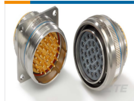
TE 产品编号ZPF10000000008712 983-6SE 08-03 S6 L