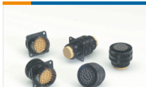
TE 产品编号ZPF000000000202614 FDBA 50-14-19 PN-K-A1025