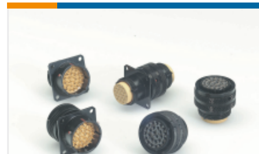
TE 产品编号ZPF00000000018700 FDBA 50-8-98 SN-K 090