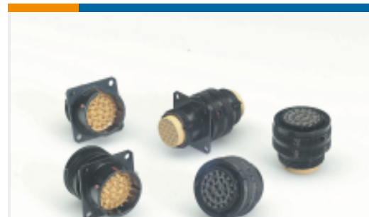
TE 产品编号ZPF000000000202613 FDBA 50-12-10 SN-K-A1025