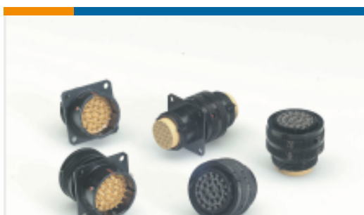
TE 产品编号ZPF000000000107569 FDBA 54-22-41 SN-K 090