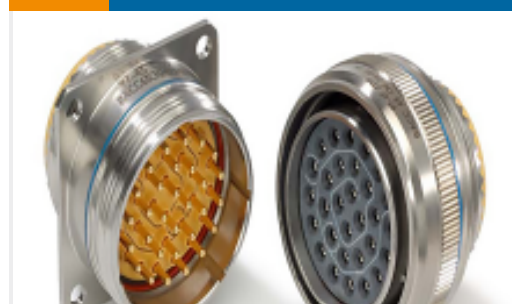
TE 产品编号ZPF00000000036636 983-6S 18-14 PN-L