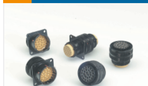
TE 产品编号ZPF00000000019021 FDBA 54-22-55 SN-K 090