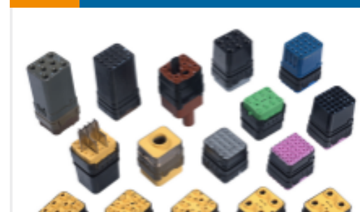
TE 产品编号ZPF000000000206305 DMC-M 22-10 PC