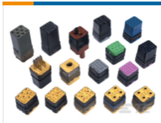
TE 产品编号ZPF000000000015217 DMC-M 08-16 AD