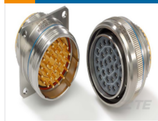
TE 产品编号ZPF000000000008674 983-6S 20-41 PN-L