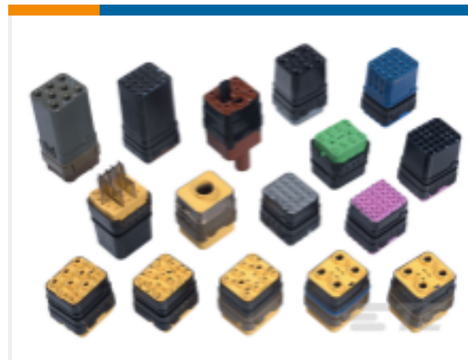
TE 产品编号ZPF0000000000206299 DMC-M 22-07 PB