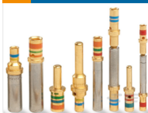
TE 产品编号ZPF00000000001935 182-0120-20