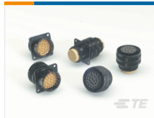
TE 产品编号ZPF000000000098318 FDBA 57-14-15 SN-K 090 A838