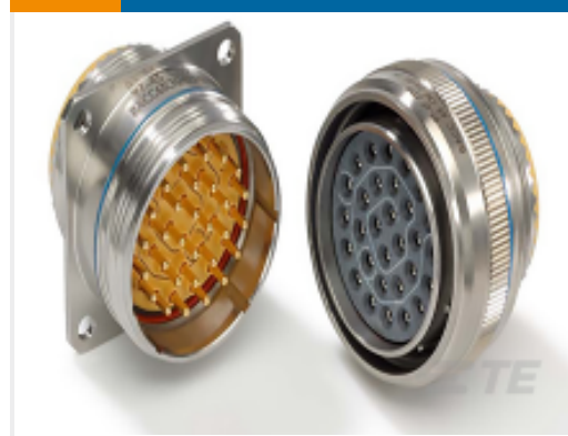
TE 产品编号ZPF000000000033437 983-0S 20-41 S6 L