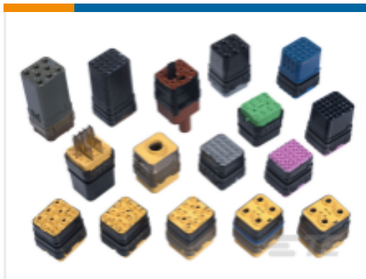
TE 产品编号ZPF000000000015150 DMC-M 01-08 BA