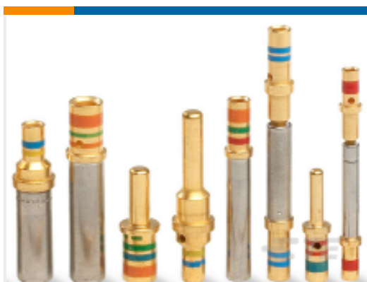
TE 产品编号 ZPF000000000000345 006-0912-20 A