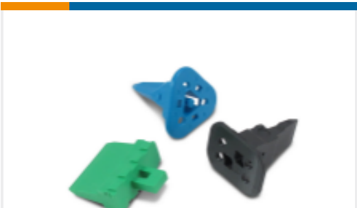
TE 产品编号W2S Wedgelocks: DEUTSCH DT