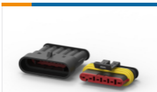
TE 产品编号282104-1 AMP SUPERSEAL 1.5MM, 连接器壳体