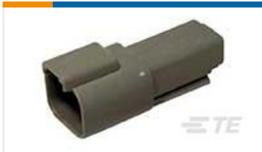
TE 产品编号DT04-2P REC, 2P, GRY, N