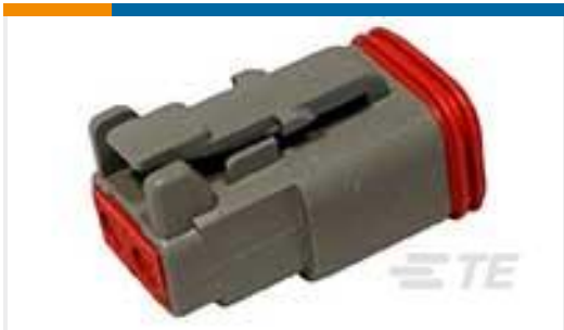
TE 产品编号DT06-2S PLG, 2P, GRY, N