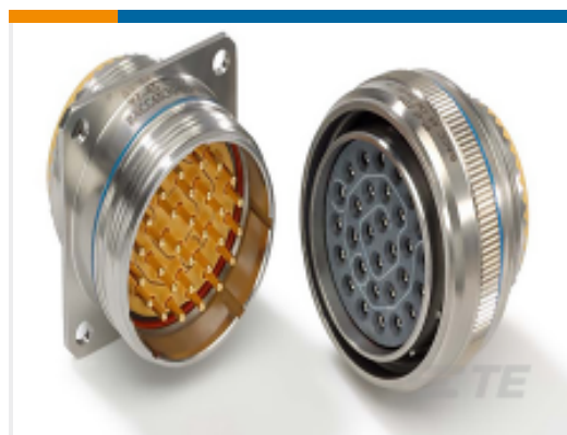
TE 产品编号ZPF000000000007174 983-ORS 08-98 PN