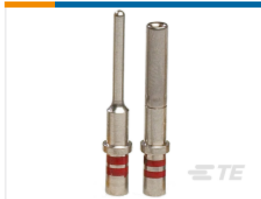
TE 产品编号ZPF00000000001261 097-0267-16 A1267