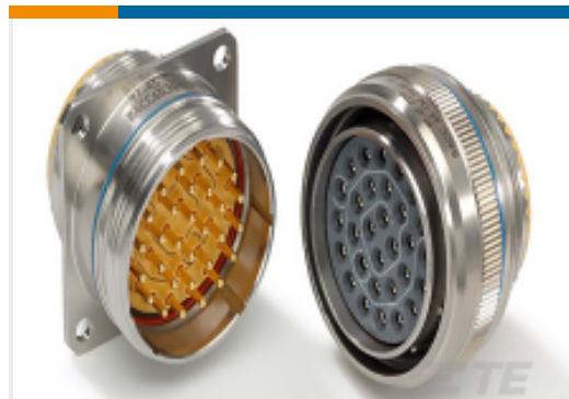
TE 产品编号ZPF000000000007174 983-ORS 08-98 PN