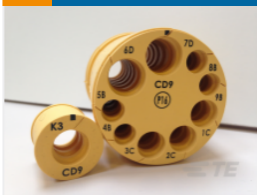
TE 产品编号ZPF000000000100448 054-8017-03