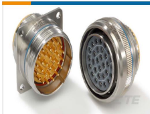
TE 产品编号ZPF100000000007585 983-0SE 14-15 S7 L