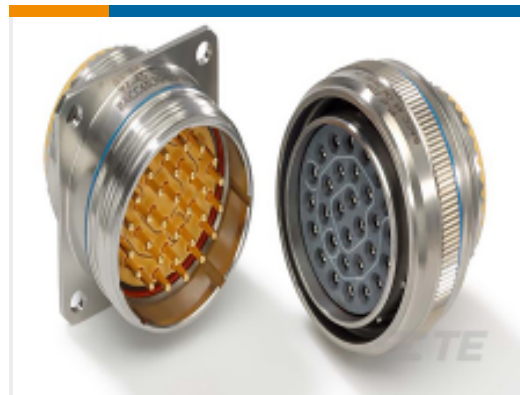
TE 产品编号ZPF100000000008707 983-6SE 08-03 PN-L