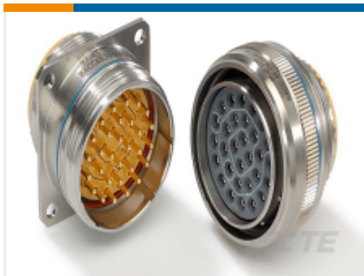
TE 产品编号ZPF100000000007512 983-0SE 10-06 SN-L