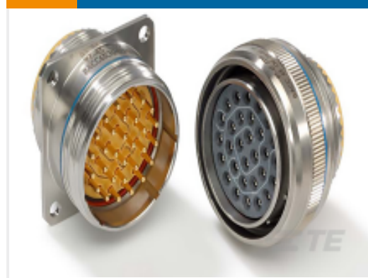
TE 产品编号ZPF000000000008956 983-6SE 20-25 PN-L