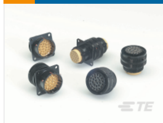
TE 产品编号ZPF000000000018325 FDBA 50-18-32 PY-K 090