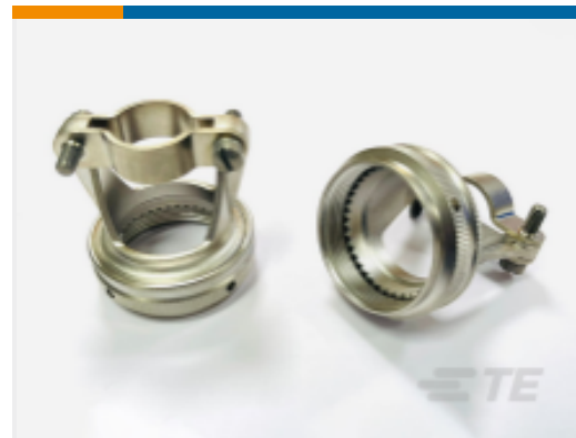
TE 产品编号2275011-6 ASSY,EN3660-004, SS-PA BACKSHELL, SZ18