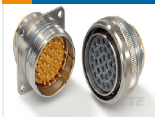
TE 产品编号ZPF000000000007560 983-0SE 14-04 SN-L