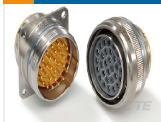
TE 产品编号ZPF10000000008792 983-6SE 12-03 SN-L