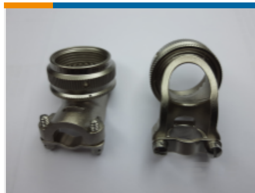
TE 产品编号2-2275012-2 ASSY,EN3660-005, AL-NI BACKSHELL, SZ10