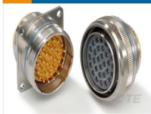
TE 产品编号ZPF10000000008319 983-6R 10-06 SN-L