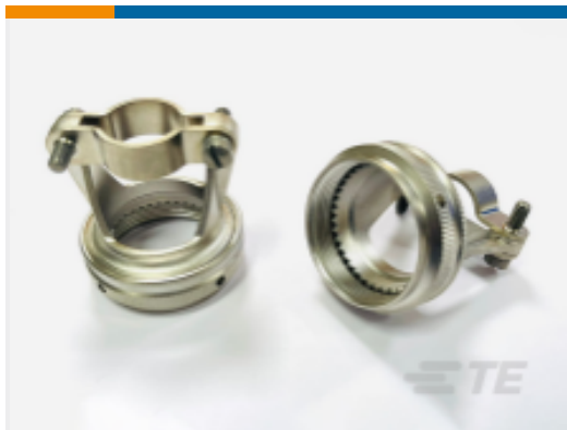
TE 产品编号2-2275010-2 ASSY,EN3660-004, AL-NI BACKSHELL, SZ10