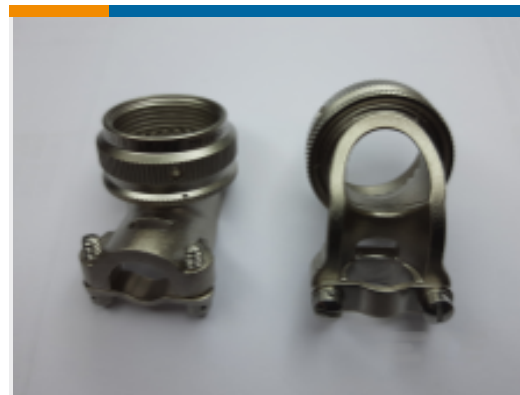
TE 产品编号2275013-3 ASSY,EN3660-005, SS-PA BACKSHELL, SZ12