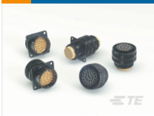
TE 产品编号ZPF00000000018263 FDBA 50-16-26 SN-K 090 A499