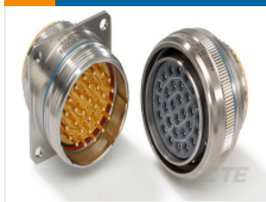
TE 产品编号ZPF10000000008227 983-6KE 12-03 SN-L