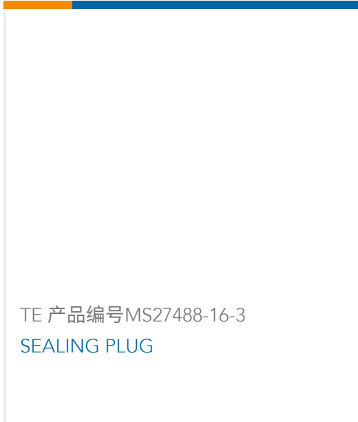
TE 产品编号MS27488-16-3 SEALING PLUG