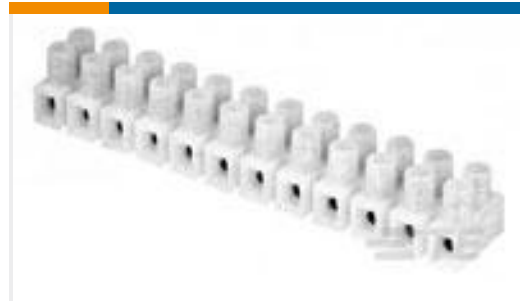
TE 产品编号1776293-8 TSB23008DS=EUROPA TERM BLK, 8MM