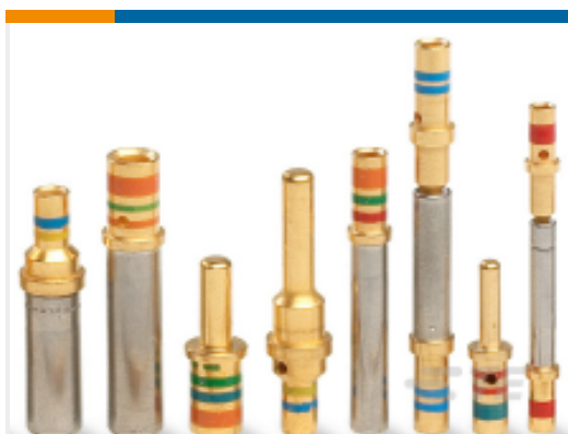
TE 产品编号 ZPF000000000001246 097-0205-20