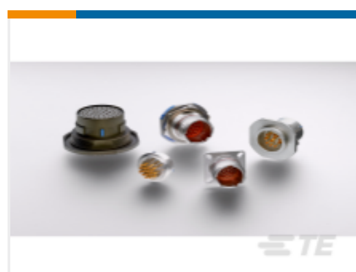
TE 产品编号YDTS20Y13-98XNV001 HERM RECP