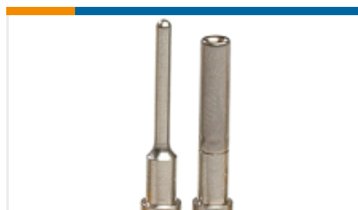
TE 产品编号ZPF000000000001261 097-0267-16 A1267