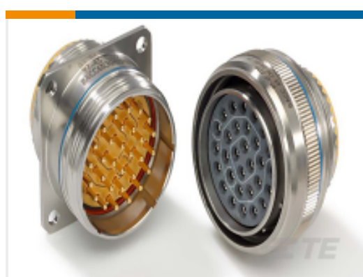
TE 产品编号ZPF0000000000007174 983-ORS 08-98 PN