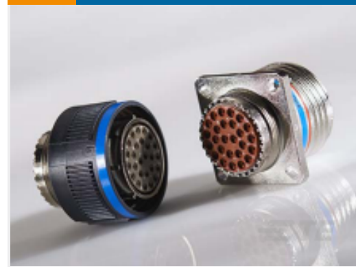
TE 产品编号ZPF00000000017195 DTS 26 S 17-26 SN