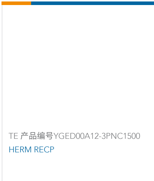
TE 产品编号YGED00A12-3PNC1500 HERM RECP