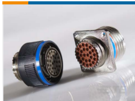
TE 产品编号ZPF00000000017207 DTS 26 S 23-53 SE