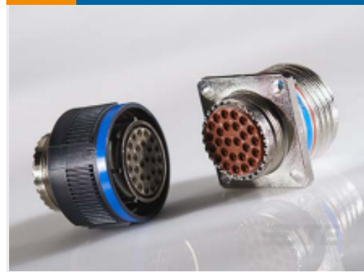
TE 产品编号ZPF00000000017193 DTS 26 S 17-26 SA