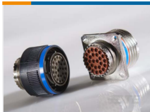
TE 产品编号ZPF00000000017203 DTS 26 S 21-41 SN