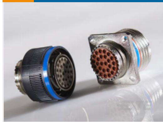
TE 产品编号ZPF00000000094881 DTS 26 S 13-08 SN