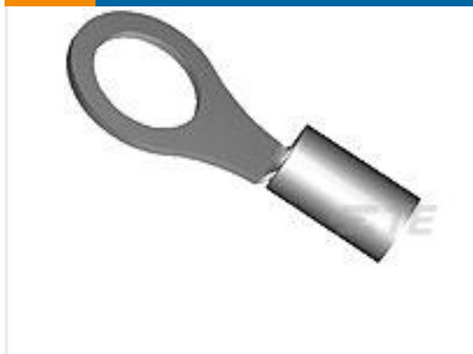
TE 产品编号30993 TERMINAL,DG R 16-14 10