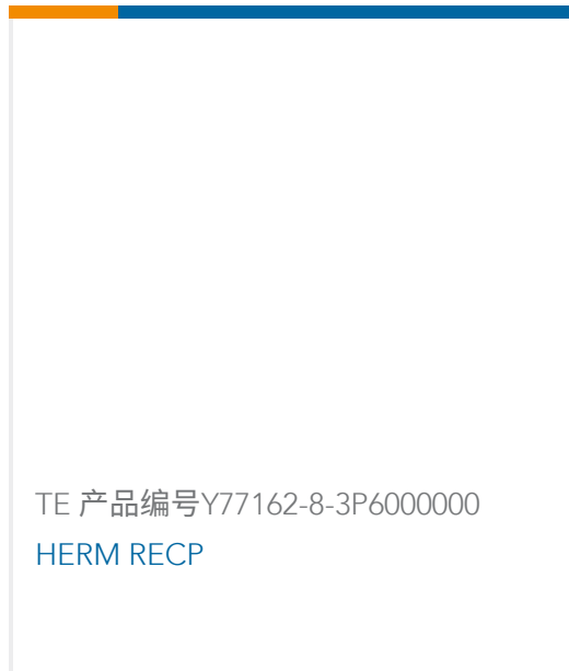
TE 产品编号Y77162-8-3P6000000 HERM RECP