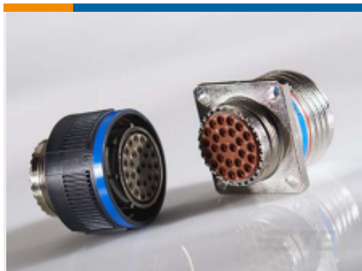
TE 产品编号ZPF00000000017198 DTS 26 S 19-32 SA