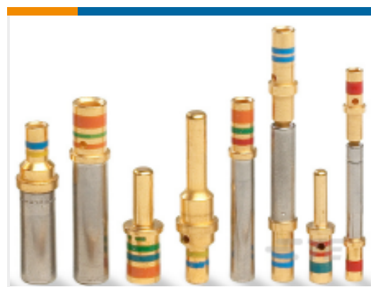
TE 产品编号 ZPF000000000001201 097-0015-20