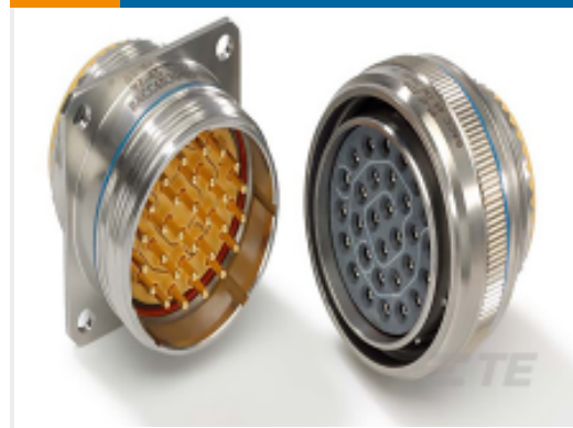
TE 产品编号ZPF100000000009142 983-7SE 16-24 PN-L