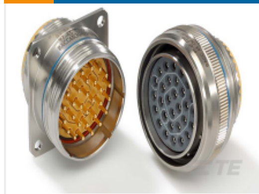
TE 产品编号ZPF100000000008809 983-6SE 12-12 S7 L