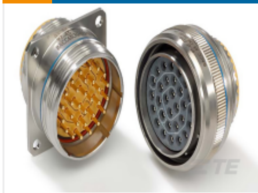
TE 产品编号ZPF100000000008743 983-6SE 10-05 PN-L