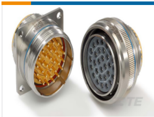
TE 产品编号ZPF00000000007815 983-0Y 10-06 PN