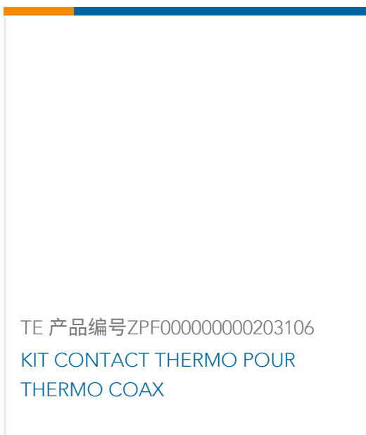
TE 产品编号ZPF00000000203106 KIT CONTACT THERMO POUR THERMO COAX