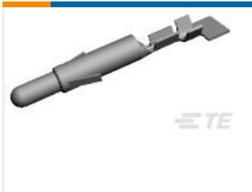
TE 产品编号770672-1 UMNL PIN 30-26 PTPBR L/P