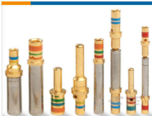
TE 产品编号ZPF00000000001743 134-0051-20