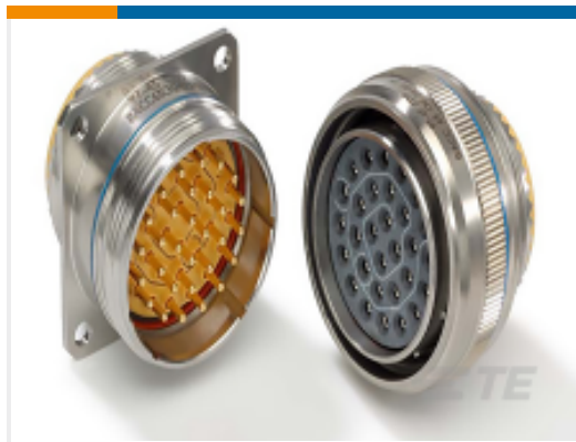
TE 产品编号ZPF00000000009098 983-6WS 10-06 SN