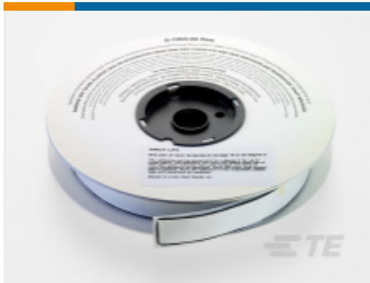
TE 产品编号195133-000 S1255-04-3/4X100FT