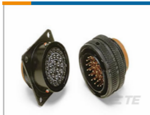
TE 产品编号ZPF00000000025964 910-6E 08-33 PN 01