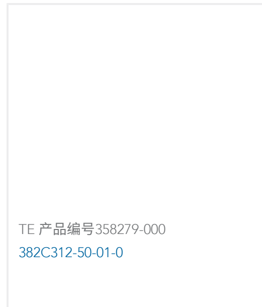
TE 产品编号358279-000 382C312-50-01-0