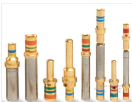
TE 产品编号 ZPF000000000001201 097-0015-20