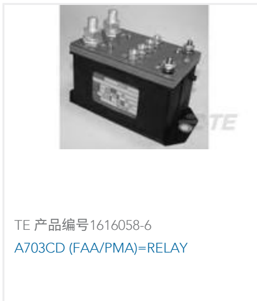
TE 产品编号1616058-6 A703CD (FAA/PMA)=RELAY