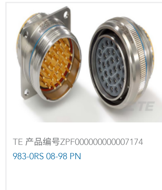
TE 产品编号ZPF000000000007174 983-ORS 08-98 PN