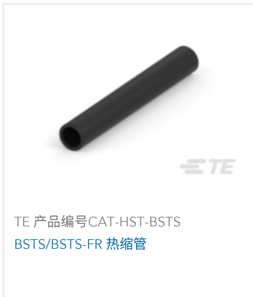
TE 产品编号CAT-HST-BSTS BSTS/BSTS-FR 热缩管