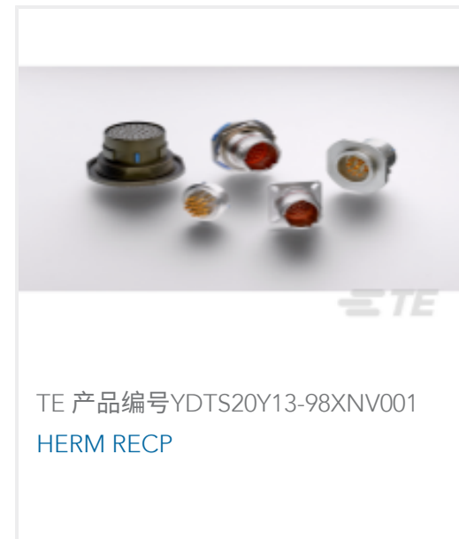
TE 产品编号YDTS20Y13-98XNV001 HERM RECP