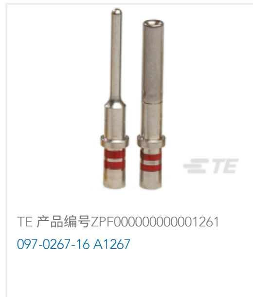
TE 产品编号ZPF00000000001261 097-0267-16 A1267