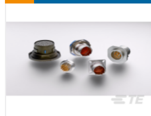
TE 产品编号YDTS20Y11-35XA0000 HERM RECP