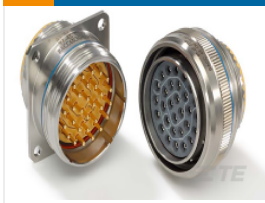
TE 产品编号ZPF000000000007806 983-0Y 08-03 PN