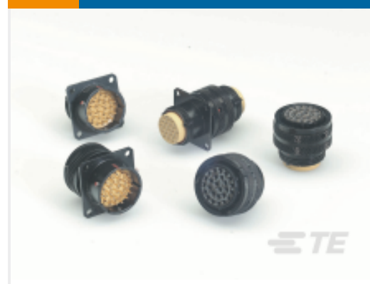
TE 产品编号ZPF0000000000018746 FDPA 50H 16-26 PN-K