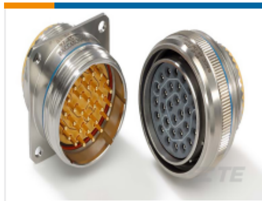
TE 产品编号ZPF100000000036174 983-6RS 18-08 P6 L