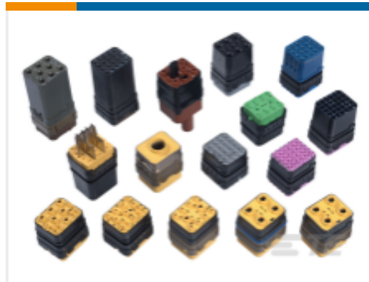
TE 产品编号ZPF000000000114469 DMC-M 22-07 BC