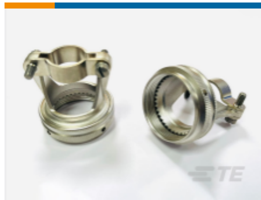
TE 产品编号1-2275011-0 ASSY,EN3660-004, SS-PA BACKSHELL, SZ28