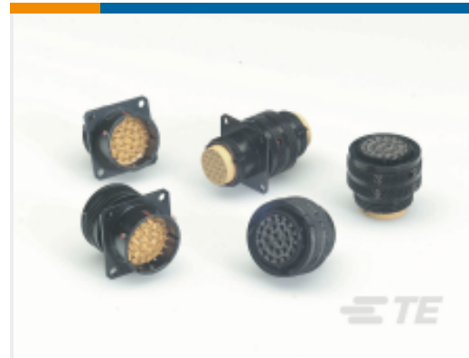
TE 产品编号ZPF00000000019235 FDBA 56-14-12 PX-K 090