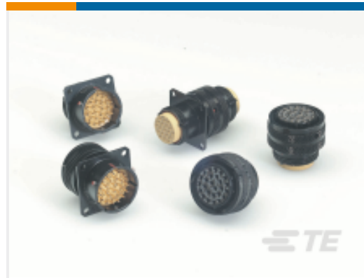
TE 产品编号ZPF00000000018125 FDBA 50-14-19 PN-K 090 A838