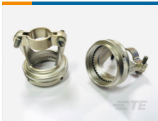
TE 产品编号1-2275011-0 ASSY,EN3660-004, SS-PA BACKSHELL, SZ28