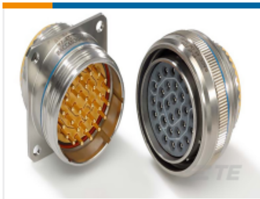
TE 产品编号ZPF100000000008721 983-6SE 08-03 S9 L