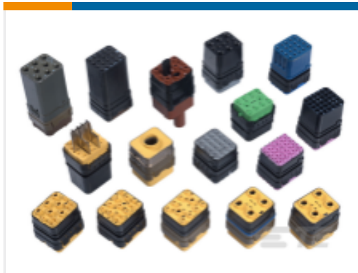
TE 产品编号ZPF000000000114469 DMC-M 22-07 BC