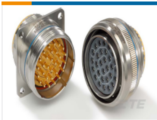
TE 产品编号ZPF100000000036174 983-6RS 18-08 P6 L