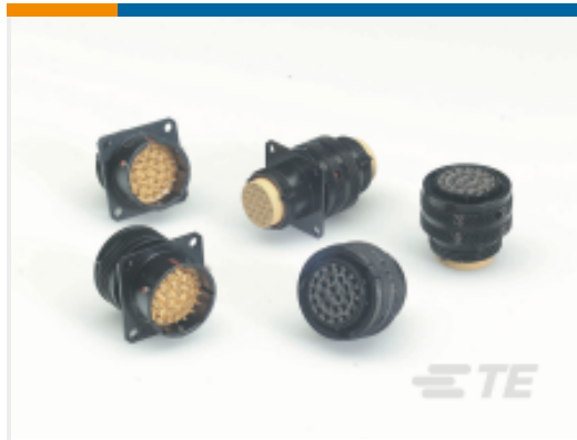
TE 产品编号ZPF00000000018125 FDBA 50-14-19 PN-K 090 A838