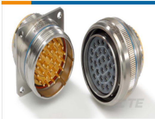
TE 产品编号ZPF000000000201596 983-6SE 24-43 SY-L