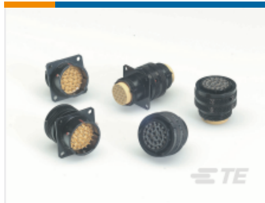
TE 产品编号ZPF00000000019235 FDBA 56-14-12 PX-K 090