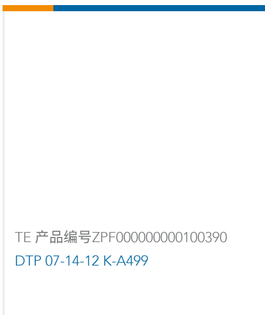
TE 产品编号ZPF000000000100390 DTP 07-14-12 K-A499