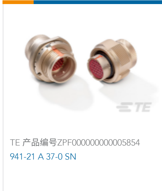
TE 产品编号 ZPF000000000005854 941-21 A 37-0 SN