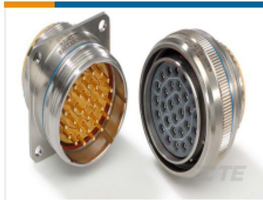
TE 产品编号ZPF000000000008117 983-6K 14-15 SN