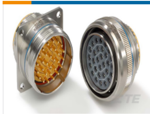
TE 产品编号ZPF000000000008688 983-6S 22-55 SN