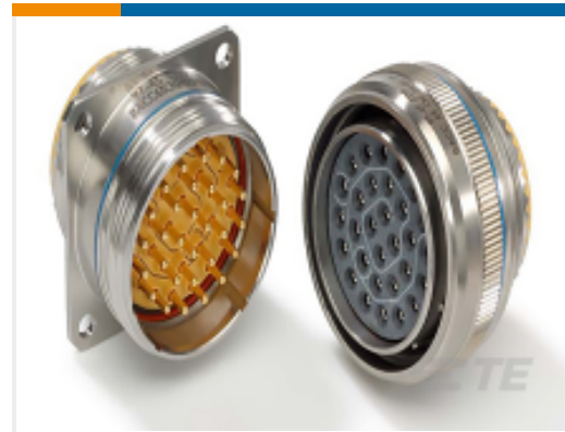
TE 产品编号ZPF000000000008076 983-6K 10-05 SN