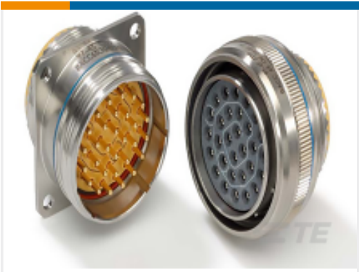
TE 产品编号ZPF000000000036775 983-6S 22-19 SN