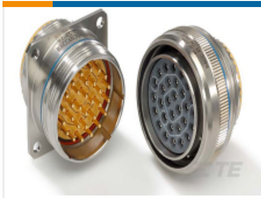
TE 产品编号ZPF000000000122828 983-0S 20-04 SN-A1301