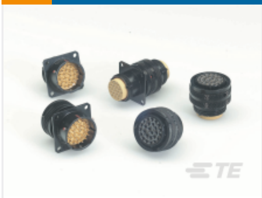
TE 产品编号ZPF00000000018391 FDBA 50-20-41 PN-K