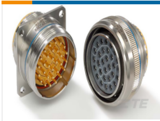
TE 产品编号ZPF000000000149093 983-0Y 10-12 P6