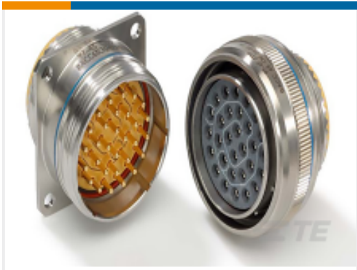
TE 产品编号ZPF000000000122826 983-6S 20-04 PN-A1301