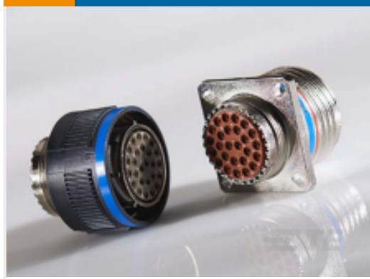
TE 产品编号ZPF000000000138173 DTS 24 S 09-98 UB