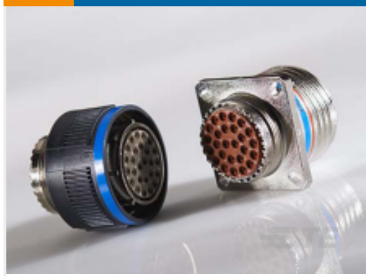
TE 产品编号ZPF000000000138171 DTS 24 S 09-98 UN