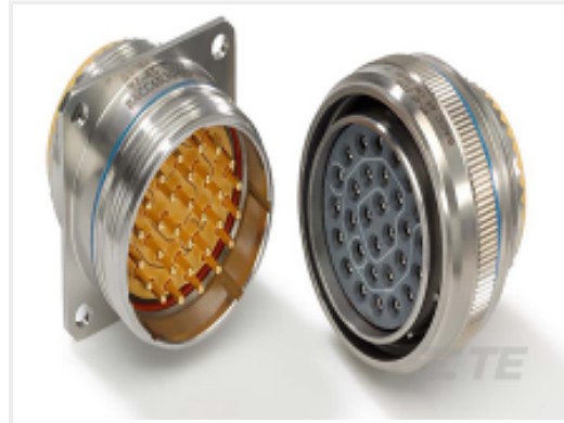
TE 产品编号ZPF000000000122826 983-6S 20-04 PN-A1301