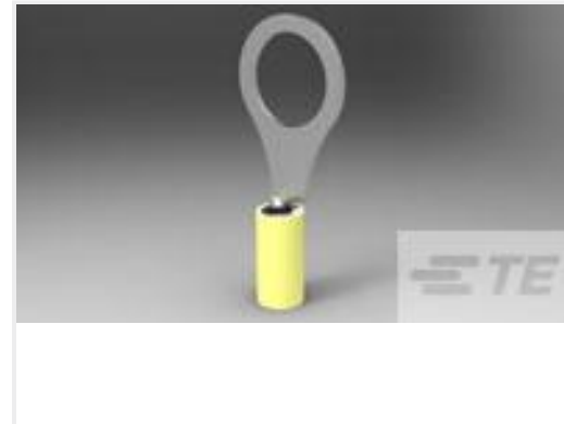
TE 产品编号320576 TERMINAL,PIDG R 12-10 5/16