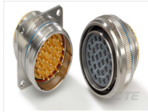
TE 产品编号ZPF00000000007806 983-0Y 08-03 PN