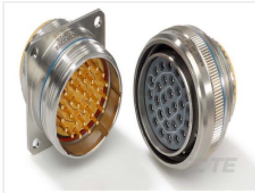
TE 产品编号ZPF000000000122828 983-0S 20-04 SN-A1301