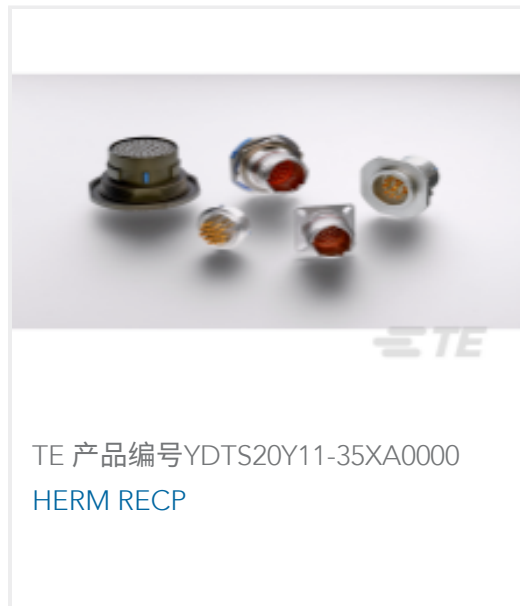
TE 产品编号YDTS20Y11-35XA0000 HERM RECP