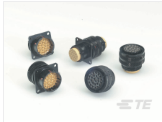
TE 产品编号ZPF00000000018746 FDBA 50H 16-26 PN-K