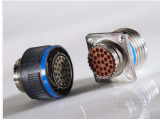
TE 产品编号ZPF000000000138174 DTS 24 S 09-98 UC