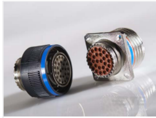
TE 产品编号ZPF000000000138169 DTS 24 S 11-35 UN