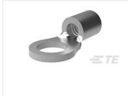
TE 产品编号32994 TERMINAL,SOLIS R 12-10 8