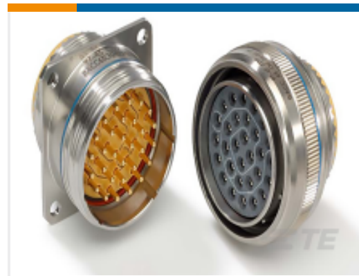
TE 产品编号 ZPF000000000037028 983-6SE 18-08 S6