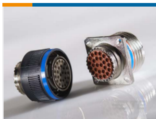
TE 产品编号 ZPF000000000094669 DTS 26 K 15-97 PA