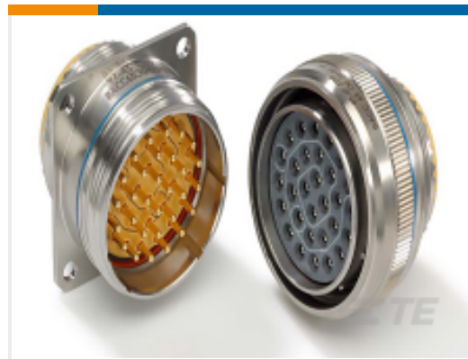
TE 产品编号 ZPF000000000037023 983-6SE 18-08 P8