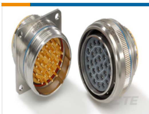
TE 产品编号 ZPF000000000037034 983-6SE 18-08 S9