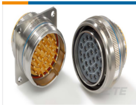
TE 产品编号 ZPF000000000037019 983-6SE 18-08 P6