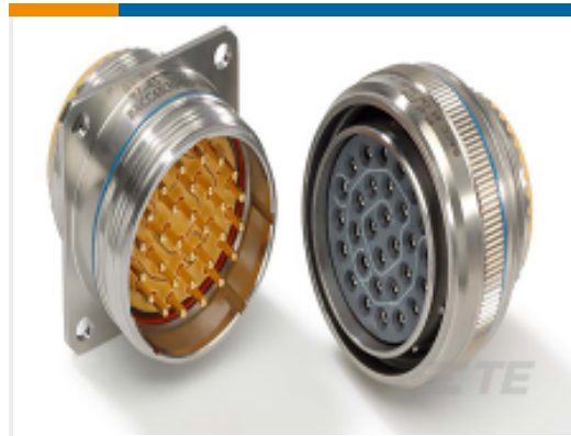
TE 产品编号 ZPF000000000106688 983-0S 18-31 PN-A1208