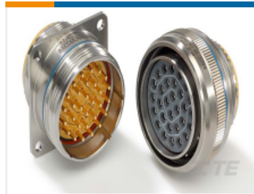
TE 产品编号 ZPF00000000008602 983-6S 14-07 PN