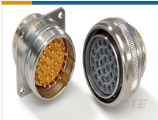
TE 产品编号 ZPF000000000008899 983-6SE 16-24 SN