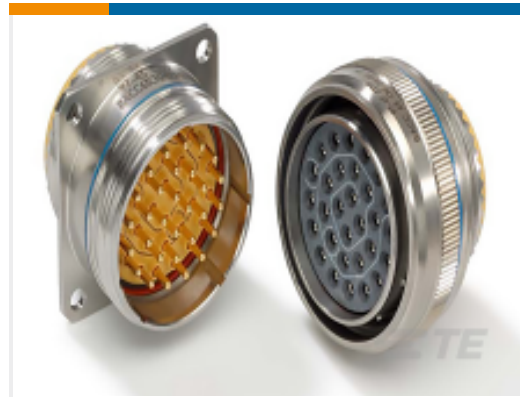
TE 产品编号 ZPF00000000007579 983-0SE 14-15 PN