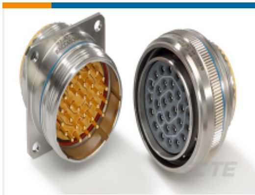
TE 产品编号 ZPF000000000008825 983-6SE 14-07 P6