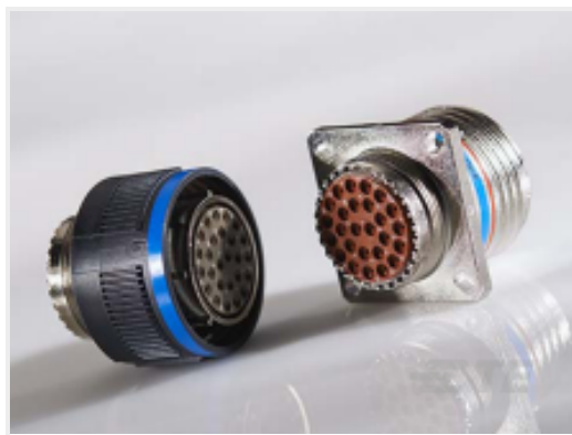
TE 产品编号ZPF00000000094669 DTS 26 K 15-97 PA