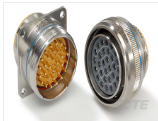
TE 产品编号ZPF00000000008703 983-6SE 08-03 P8