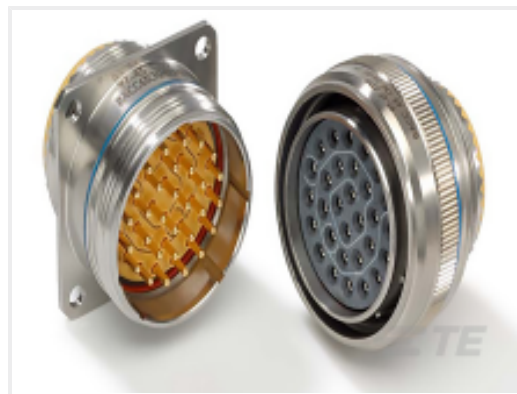
TE 产品编号ZPF000000000205454 983-6SE 22-39 SN