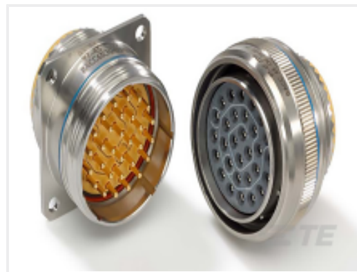
TE 产品编号ZPF000000000114632 983-6SE 22-39 PN