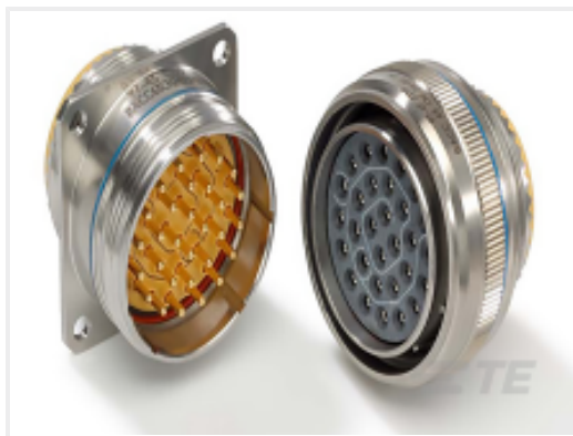
TE 产品编号ZPF00000000008887 983-6SE 16-24 PN-A1208