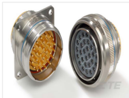
TE 产品编号ZPF000000000122640 983-6S 12-12 SN-A1208