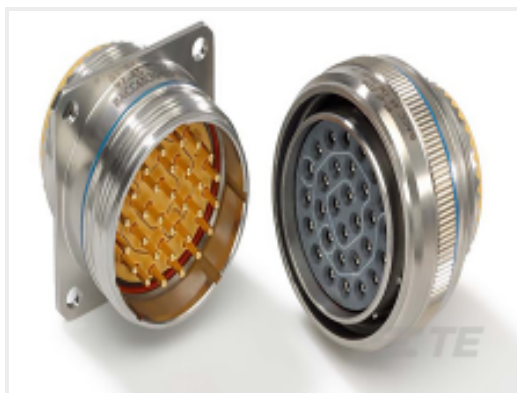
TE 产品编号ZPF000000000122658 983-0S 12-12 PN-A1208