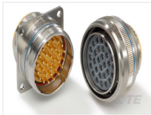
TE 产品编号ZPF00000000007374 983-0S 14-15 PN