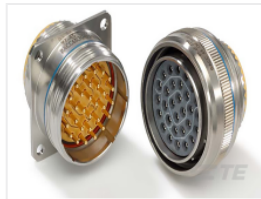
TE 产品编号ZPF00000000007462 983-0SE 08-03 P9