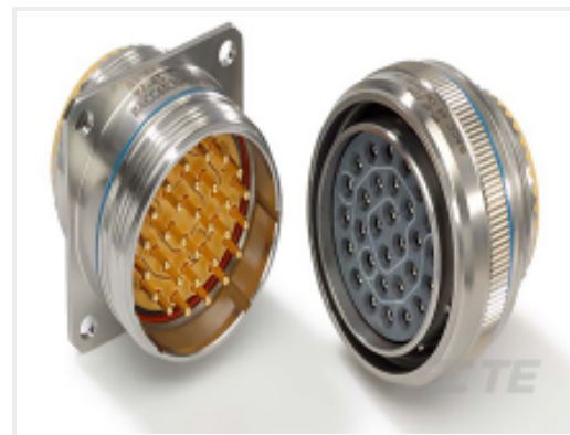
TE 产品编号ZPF000000000037028 983-6SE 18-08 S6