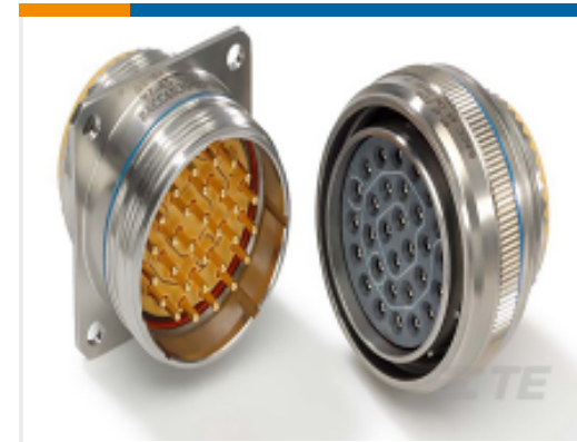
TE 产品编号ZPF000000000122661 983-0S 16-24 PN-A1208