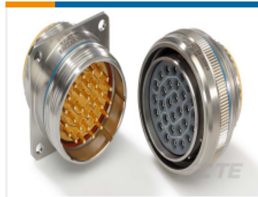
TE 产品编号ZPF000000000008910 983-6SE 18-08 SN