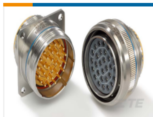
TE 产品编号ZPF00000000000114632 983-6SE 22-39 PN