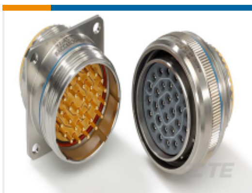
TE 产品编号ZPF0000000000037111 983-6SE 20-28 PN