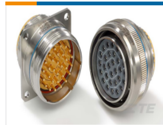
TE 产品编号ZPF0000000000037028 983-6SE 18-08 S6