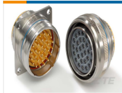
TE 产品编号ZPF000000000008632 983-6S 16-24 SN