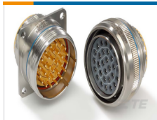
TE 产品编号ZPF000000000008703 983-6SE 08-03 P8