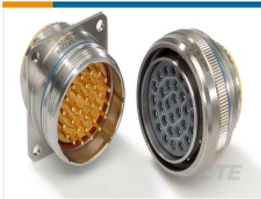
TE 产品编号ZPF000000000008800 983-6SE 12-12 PN