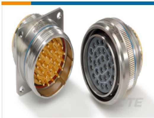
TE 产品编号ZPF000000000122640 983-6S 12-12 SN-A1208