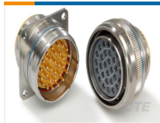
TE 产品编号ZPF000000000008825 983-6SE 14-07 P6