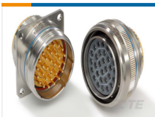
TE 产品编号ZPF0000000000033968 983-0SE 28-42 S6 L