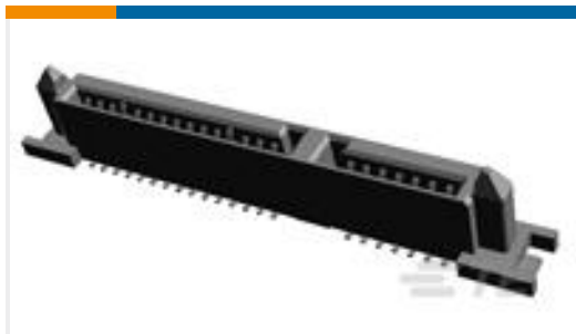
TE 产品编号1735284-5 SATA BACKPLANE RECEPTACLE, VERTICAL, SMT