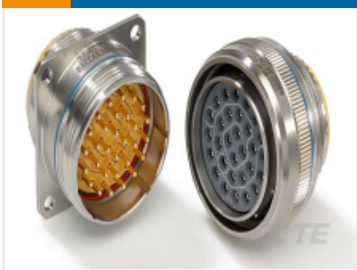
TE 产品编号ZPF000000000007489 983-0SE 10-05 PN