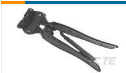
TE 产品编号46468 SADAHT STRATO 22-16 ASSY