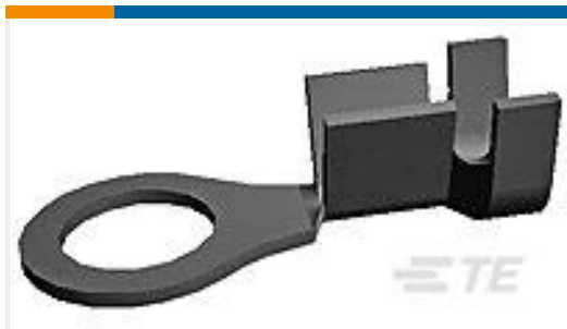
TE 产品编号42164-2 RING TERMINAL 24-20 AWG TPBR