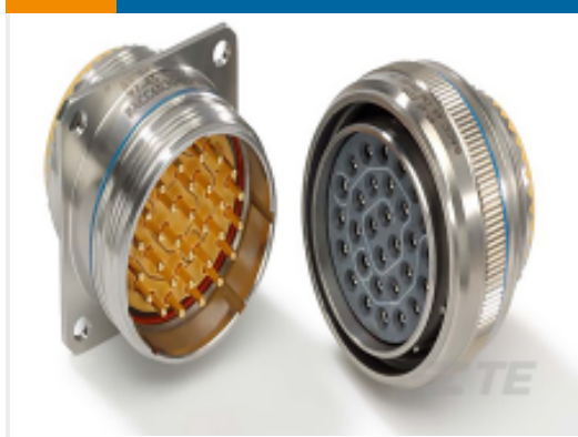
TE 产品编号ZPF000000000008202 983-6KE 10-05 SN