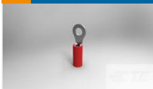
TE 产品编号2-323008-1 PIDG R 22-16 COMM 22-18 MIL 6