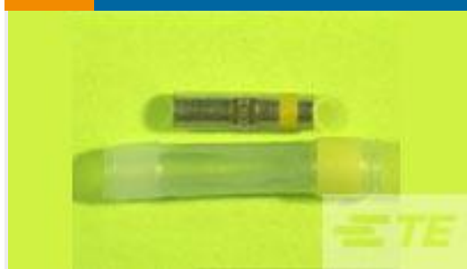
TE 产品编号650134-000 D-436-90