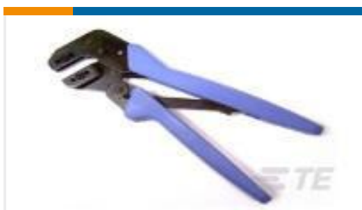
TE 产品编号58564-1 PRO-CRIMPER HT W/DIE UNIV POWR