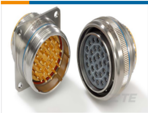
TE 产品编号ZPF000000000105169 983-6S 16-24 SN-A1208