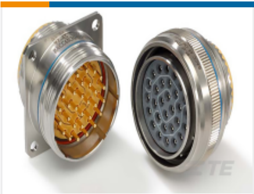
TE 产品编号ZPF000000000122655 983-6S 22-55 P6 A1208