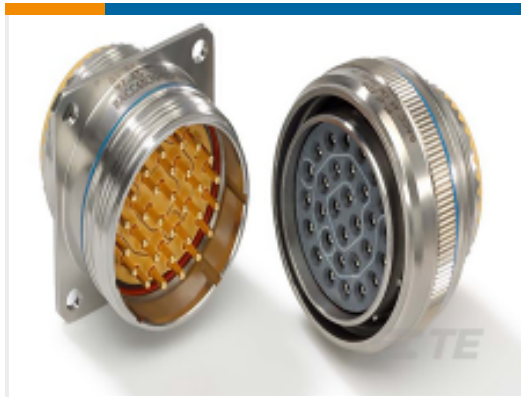
TE 产品编号ZPF000000000122661 983-0S 16-24 PN-A1208