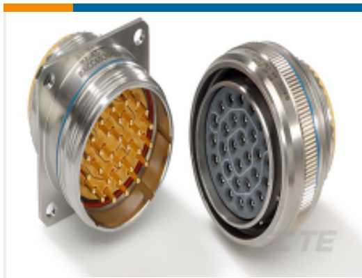
TE 产品编号ZPF000000000037023 983-6SE 18-08 P8