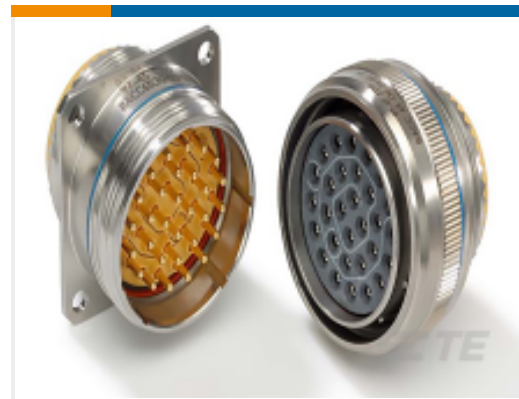
TE 产品编号ZPF000000000205454 983-6SE 22-39 SN