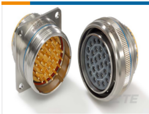
TE 产品编号ZPF000000000122646 983-6S 16-10 SN-A1208