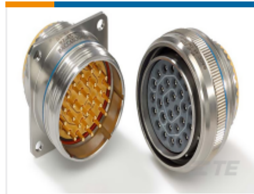
TE 产品编号ZPF00000000008602 983-6S 14-07 PN