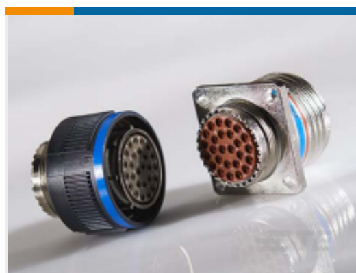
TE 产品编号ZPF000000000094669 DTS 26 K 15-97 PA