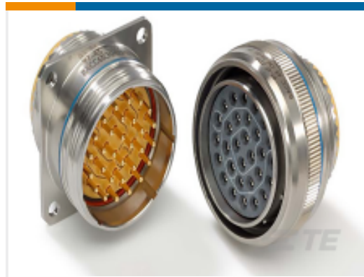
TE 产品编号ZPF000000000122658 983-0S 12-12 PN-A1208