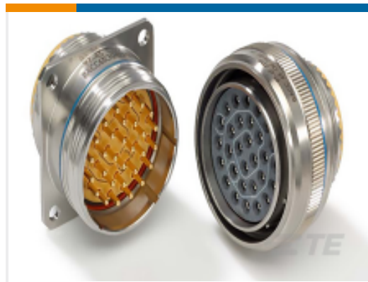
TE 产品编号ZPF00000000008887 983-6SE 16-24 PN-A1208