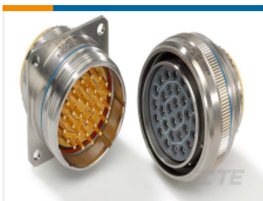
TE 产品编号ZPF000000000114138 983-6SE 24-30 PN-A1208