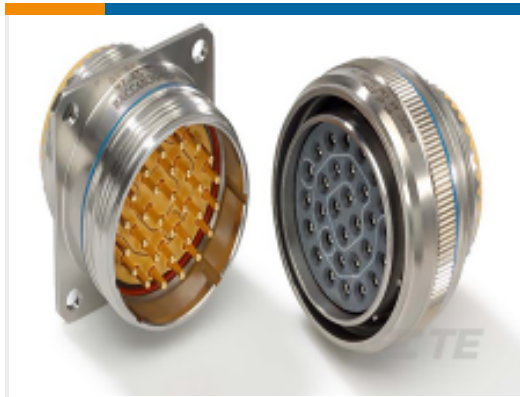
TE 产品编号ZPF000000000007318 983-0S 10-05 P6 A246