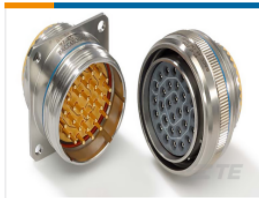
TE 产品编号ZPF000000000037034 983-6SE 18-08 S9