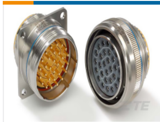
TE 产品编号ZPF000000000122659 983-0S 14-15 PN-A1208