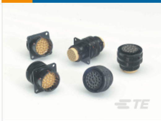
TE 产品编号ZPF000000000020032 FDBA 57-22-41 SN-K 090 A499