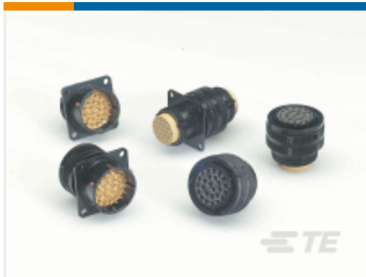
TE 产品编号ZPF000000000019280 FDBA 56-14-19 PN-K