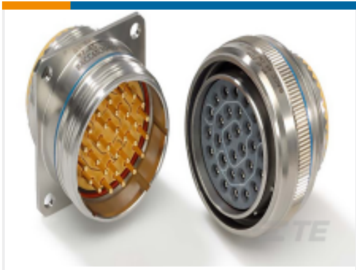
TE 产品编号ZPF000000000008052 983-3KE-N 14