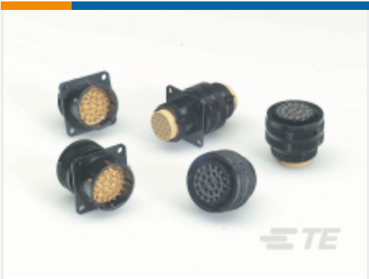
TE 产品编号ZPF000000000019589 FDBA 56-22-12 PN-K 090