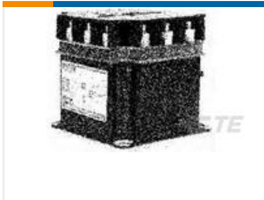
TE 产品编号1616043-7 B-140AP-1=RELAY