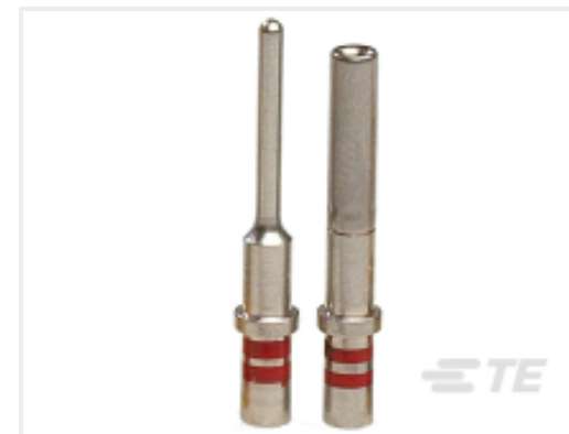
TE 产品编号ZPF000000000001261 097-0267-16 A1267