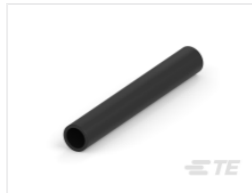
TE 产品编号CAT-HST-BSTS BSTS/BSTS-FR 热缩管