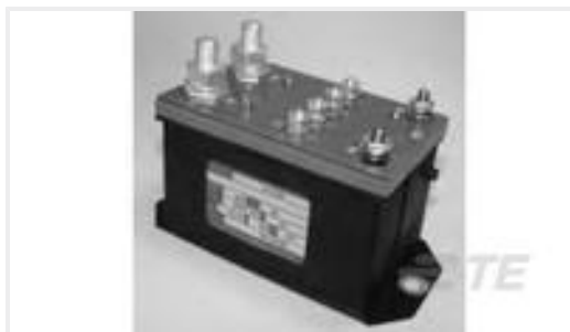
TE 产品编号1616058-6 A703CD (FAA/PMA)=RELAY