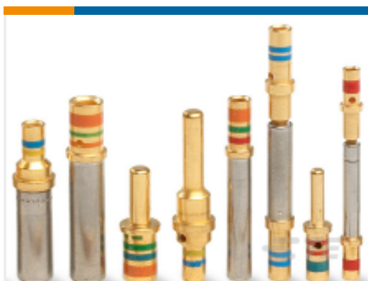
TE 产品编号 ZPF000000000001203 097-0016-20