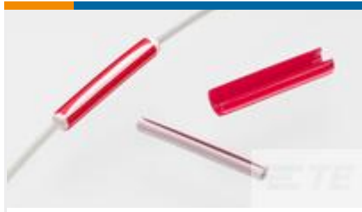
TE 产品编号CX2096-000 D-150-C-12