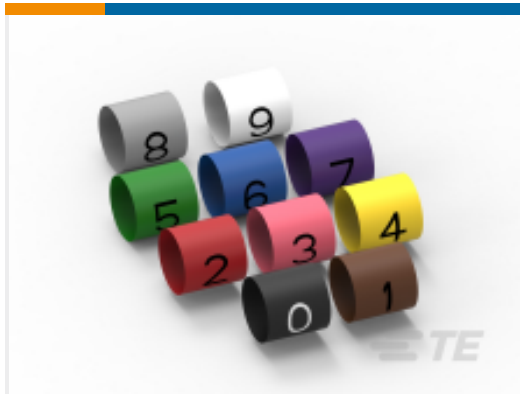
TE 产品编号3580590008 TRSA-1019/C/1/2