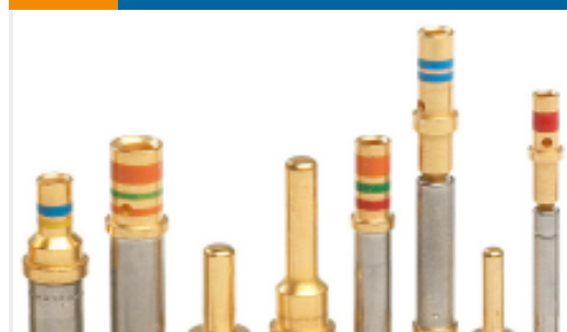
TE 产品编号ZPF000000000000570 020-0511-20