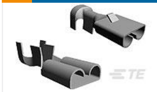
TE 产品编号60295-2 FF 250 REC 22-18AWG TPBR