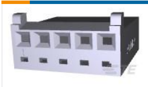
TE 产品编号1375820-5 CST-100 II HOUSING 5 POS