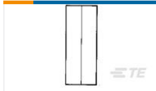
TE 产品编号134540-1 TERM, STRA, BSP, ST, 16-14, AU