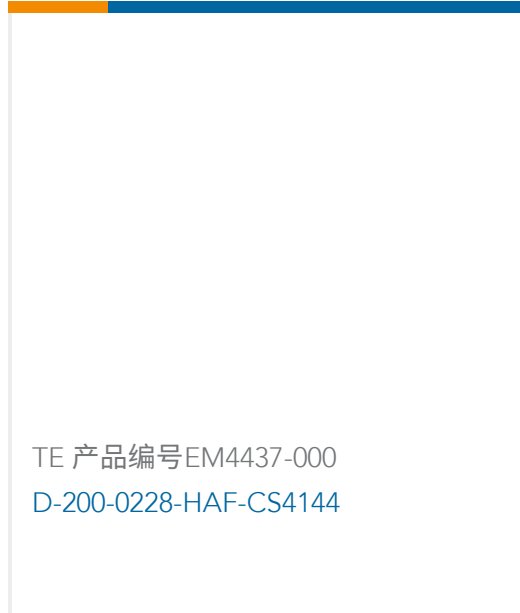
TE 产品编号EM4437-000 D-200-0228-HAF-CS4144