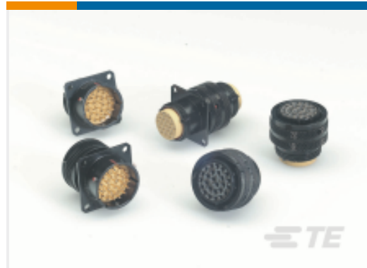
TE 产品编号ZPF000000000019068 FDBA 56-10-6 PN-K