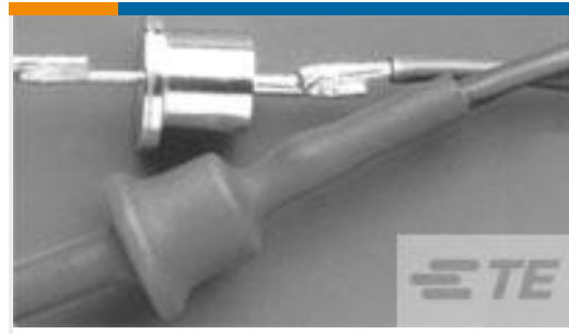
TE 产品编号5677564008 RNF-3000-3/1-0-SP