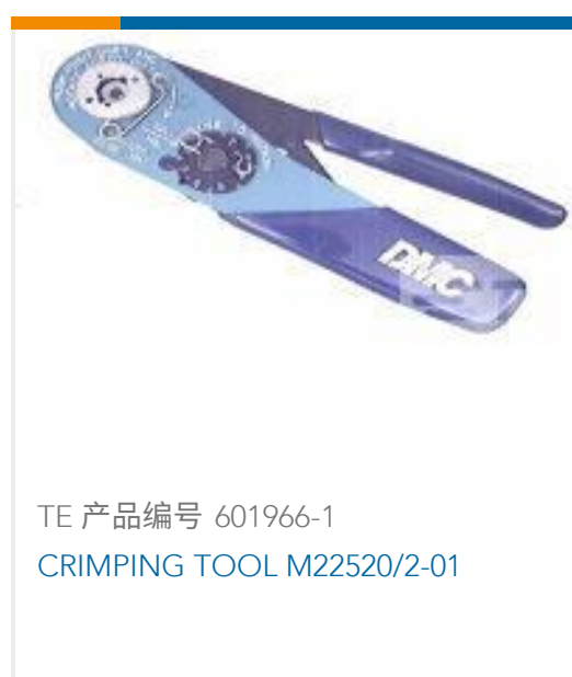
TE 产品编号 601966-1 CRIMPING TOOL M22520/2-01