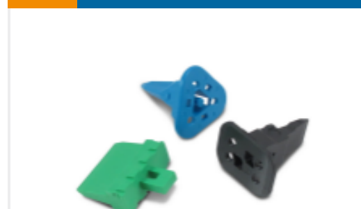
TE 产品编号W2S Wedge locks: DEUTSCH DT