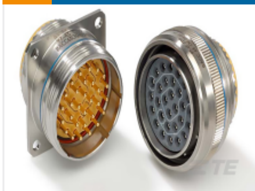
TE 产品编号ZPF000000000114505 983-0Y 14-07 PN 395