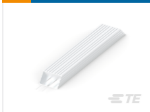
TE 产品编号3-2176510-0 CJP 500W 390R 5% Lead