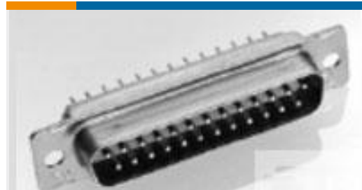
TE 产品编号204518-2 RECEPT ASSY,62 POSN,AMPLIMITE