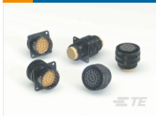
TE 产品编号ZPF000000000018824 FDBA 54-10-6 PN-K 090 A499