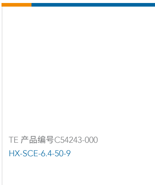
TE 产品编号C54243-000 HX-SCE-6.4-50-9