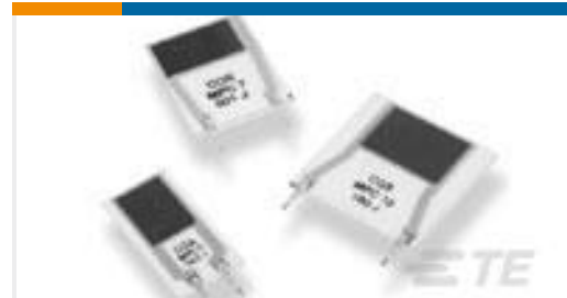
TE 产品编号1-1623776-5 MPC5 50R 5%