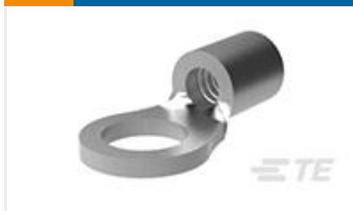
TE 产品编号34108 SOLIS R 22-16 COMM 22-18 MIL 8