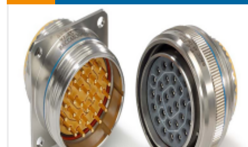
TE 产品编号ZPF000000000008099 983-6K 12-12 SN