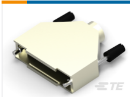
TE 产品编号5-1478762-3 Metal backshell 25 way Top Ent