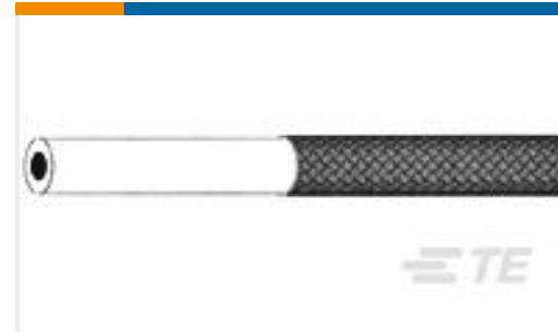
TE 产品编号A165103001 RAY-101-7.5(100)