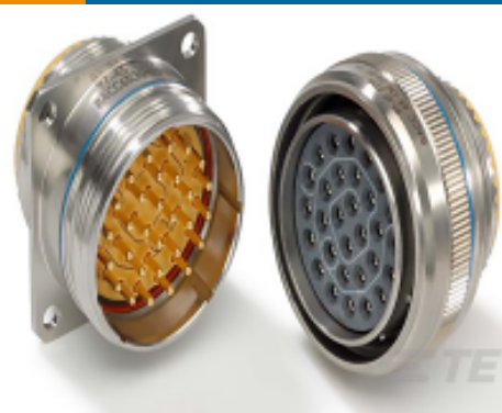
TE 产品编号358279-000 382C312-50-01-0