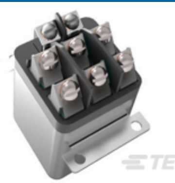
TE 产品编号ZPF0000000000007174 983-ORS 08-98 PN