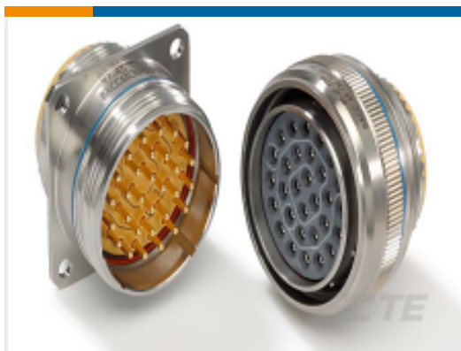
TE 产品编号ZPF000000000009137 983-7SE 12-12 PN