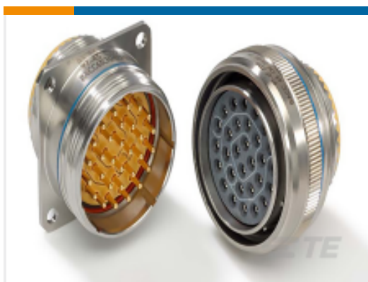
TE 产品编号ZPF0000000000202715 983-7SE 12-21 PN