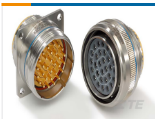
TE 产品编号ZPF000000000039374 983-7SE 08-03 PN