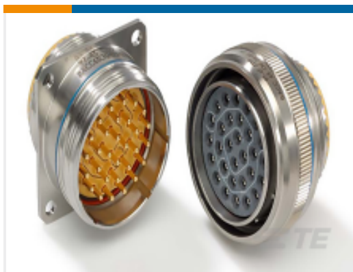
TE 产品编号ZPF000000000038461 983-7RS 14-07 SN