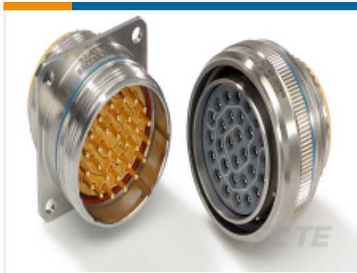
TE 产品编号ZPF000000000009138 983-7SE 12-12 SN